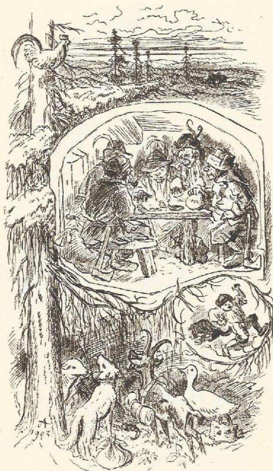
23. Zvířátka a Petrovští (národní pohádka), kresba perem, 1903