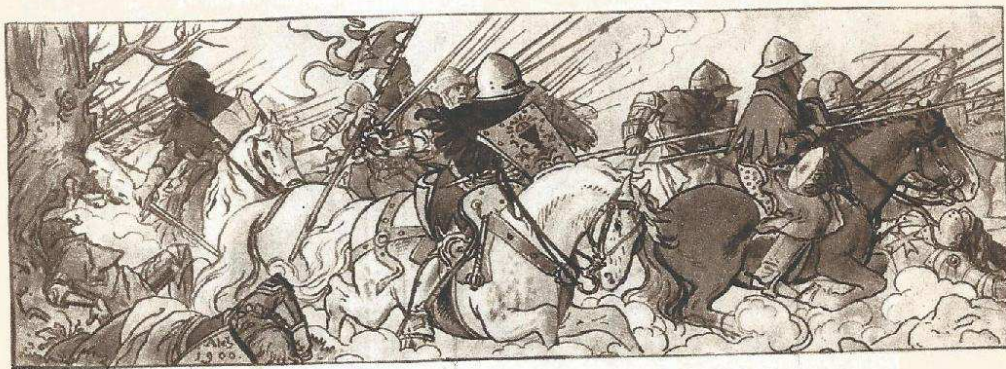
36. Útok husitské jízdy, kolorovaná kresba, 1900